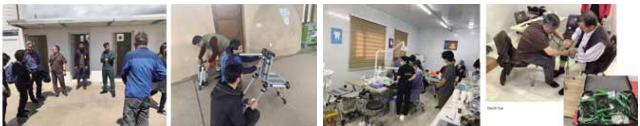
圖十五 美國醫療團攜帶衛材前來援助。