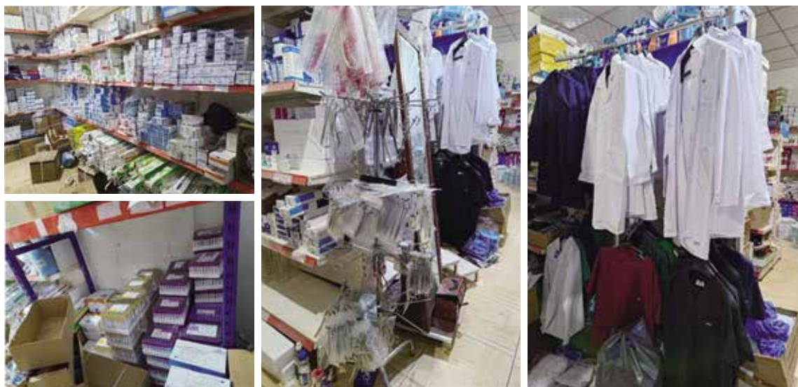
圖十八 當地衛材供應商內醫療物品。

要求雅茲迪難民自費開刀費用太高，難民常常無法負擔。我們跟泌尿外科的院長討論合作可能，他表示歡迎台灣外科醫師前去做示範手術，尤其是當地醫師無法執行的複雜手術，因此，針對需要的困難個案，找好手術醫療團隊及準備好器械，來與當地醫療機構合作是未來可以發展的醫療模式。過去也有新加坡的醫療團前來，與當地私人院所合作白內障病患手術的例子。當地也有基本的衛材的供應商店，但是精密的儀器及設備就得由國外，得經第三國帶入自治區了（圖十八）。