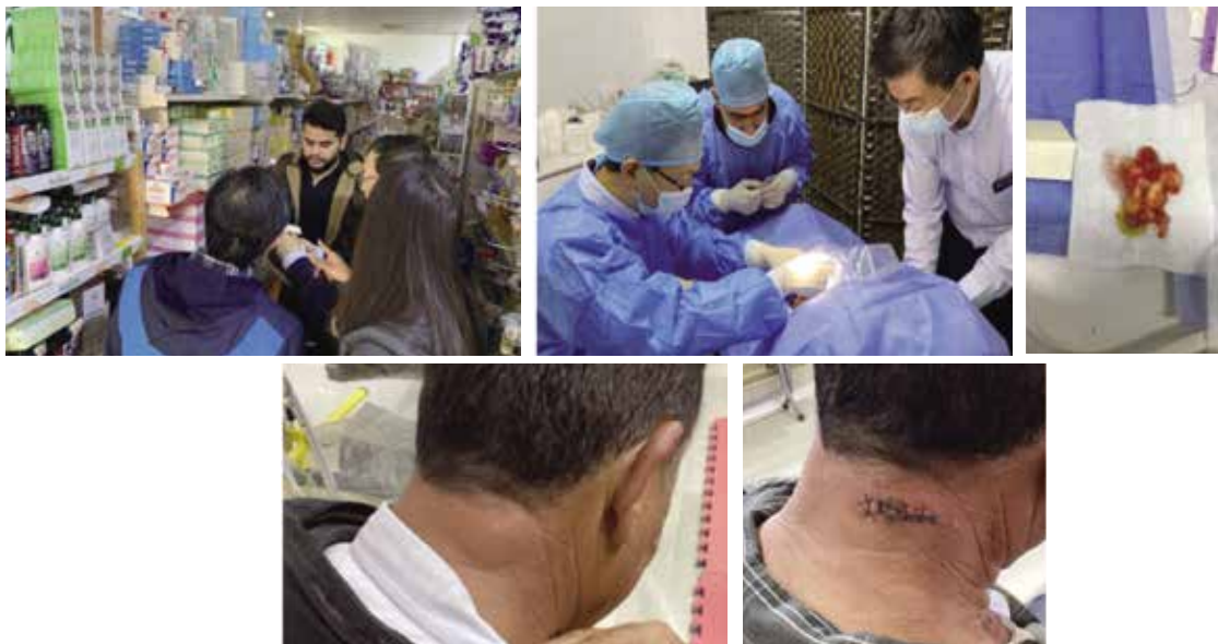
圖十四 難民營的牙科診療椅上進行皮下腫瘤切除。