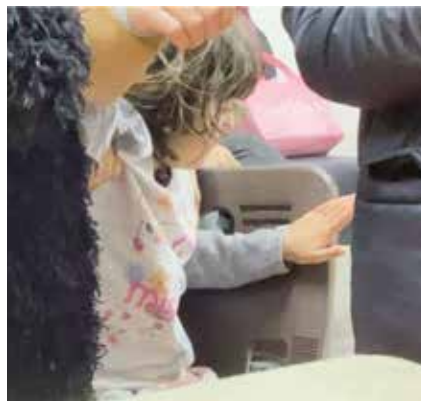
圖十二 10歲小女孩，腦性麻痺及重度綜合發展遲緩。

法治療，需由有經驗的團隊，包括耳鼻喉科、整形外科及神經外科，共同手術完成腫瘤切除（圖十三）。然而，除了經濟因素，拿伊拉克的護照要出國，進行國際醫療轉介也十分困難。