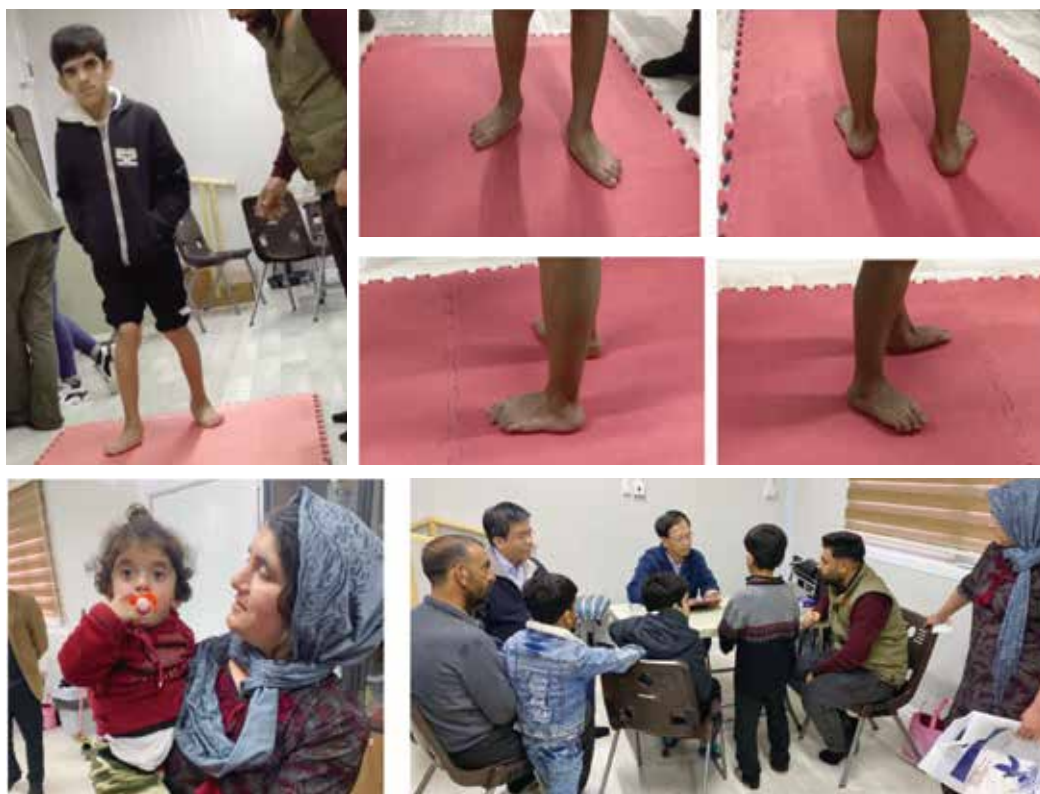
圖九 同一家庭內的四個發展遲緩及障礙的孩童。

另一位5個月先天性心臟病的可愛女嬰，心室中膈缺損-薄膜型(medium sized)，中度肺動脈狹窄，perimembranous VSD, partially closed by tricuspid septal tissue, O 2 Sat 95%，abnormal pulmonary valve with peak PG up to 60mmHg across its interventricular septum. 需要兒童心臟科專科醫師以心導管治療（圖十）。