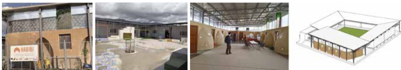
圖十六 2022年底啟用的Habibi 社區中心。