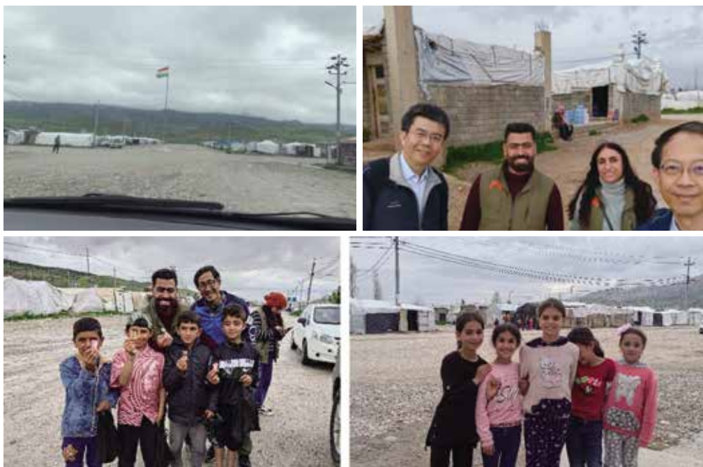
圖二 左上：難民營大門，右上：當地兩位護理師。 左下：難民營內的男童，右下：難民營內的女童。