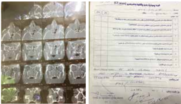
圖十三 顱底及鼻腔內腫瘤個案。

4月14日第四天，遇到從各地召集專科前來的美國醫療團，有兩位醫師，分別為內兒科及感染科及三位牙醫師，在社區中心提供兩周的醫療服務，到達當天下午就開始看診，牙科已經有許多預約病患排隊候診，內科也有許多慢性病及退化性疾病病患需要診療，台美兩地醫生合作一起看診，效率增加不少（圖十五）。