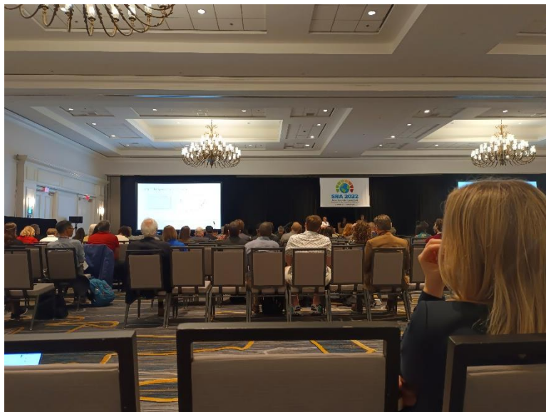
開場時的盛大演講。