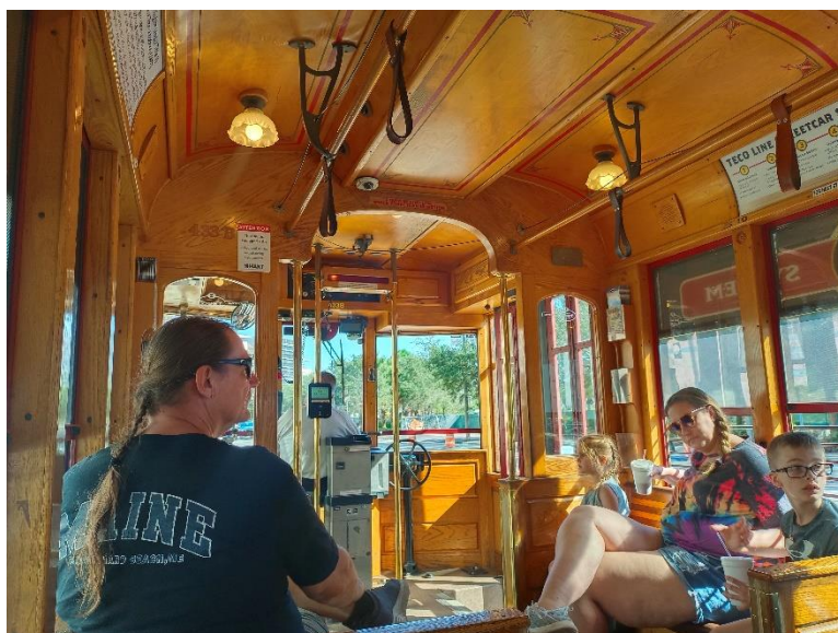
研討會過程中，忙裡偷閒搭電車出去玩。