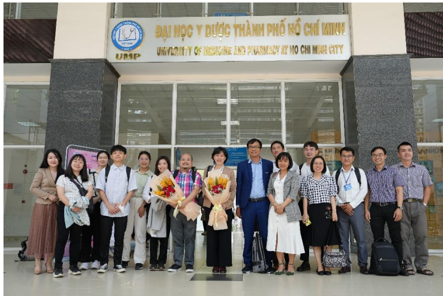
圖二：與胡志明醫藥大學簽訂 MOU 後，雙方合照留念。