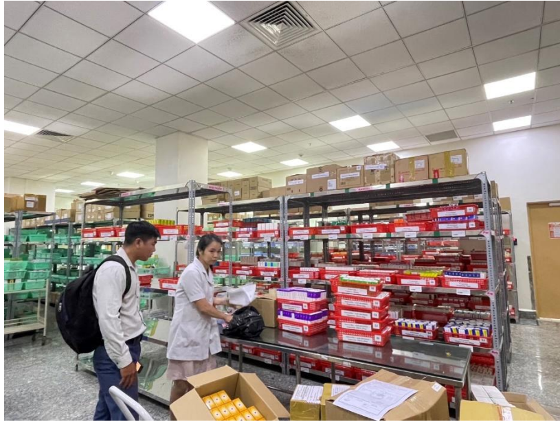
圖三：參觀震興醫院的藥庫，並協助進行藥品盤點