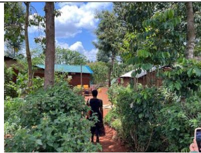
和當地社工一同參與社區沙蚤感染情形調查