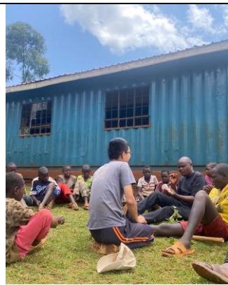
和當地夥伴一同進行潔牙衛教