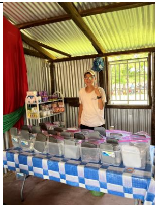
協助偏鄉醫療義診