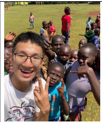
在當地舉辦周末兒童營隊