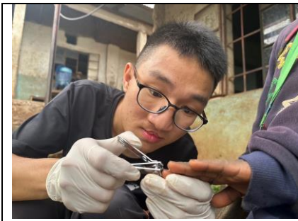
參與沙蚤計畫，分工協助民眾清潔沙蚤