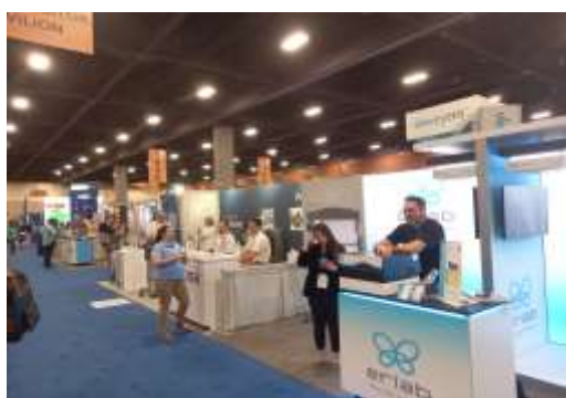
圖三、研討會廠商參展展場

除了演講與課程以外，我亦把握難得的機會去做 resume critique，這是一項一對一的活動，可以帶著自己的履歷給環職衛相關的專業人士幫忙看自己的履歷有沒有甚麼需要修正或是補充說明的部分，因為過去沒有給外國人看過履歷的經驗，所以能有這次的機會我覺得相當難得，能讓我知道一個英文母語人士的看法與見解，我覺得收穫很多。