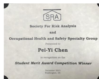
▲ 由左至右依序為：Poster Award 獲獎名單、Best Poster 獎狀、Student merit award 獎狀