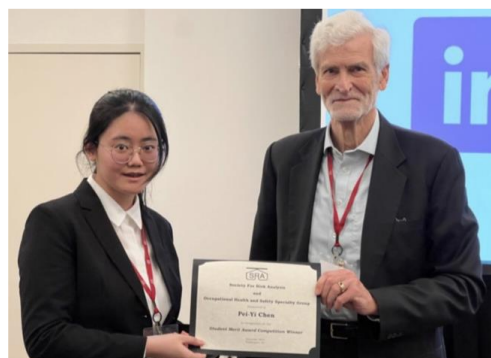
▲ 與職業健康與安全組主席合影