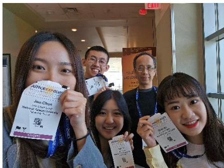
圖三、實驗室全體與老師合影