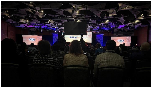
2023 美國鳳凰城 AIHce 研討會開幕典禮