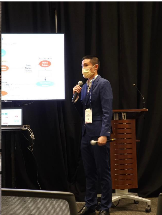
嘗試回答聽眾的問題