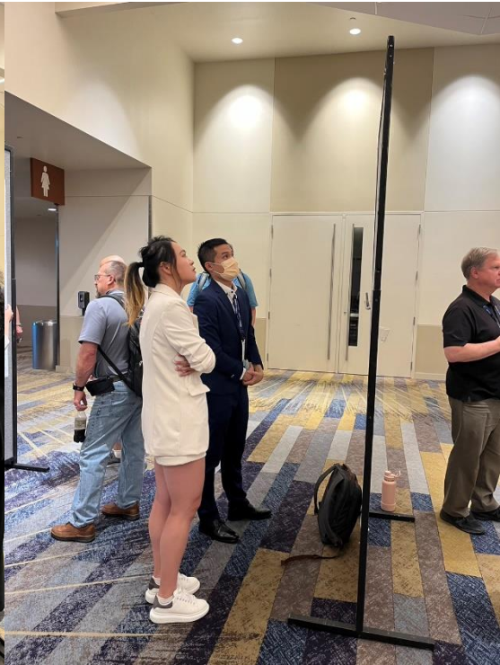
與其他與會者討論