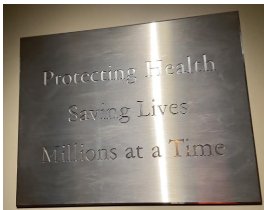
圖三 Johns Hopkins University Bloomberg 公衛學院宗旨