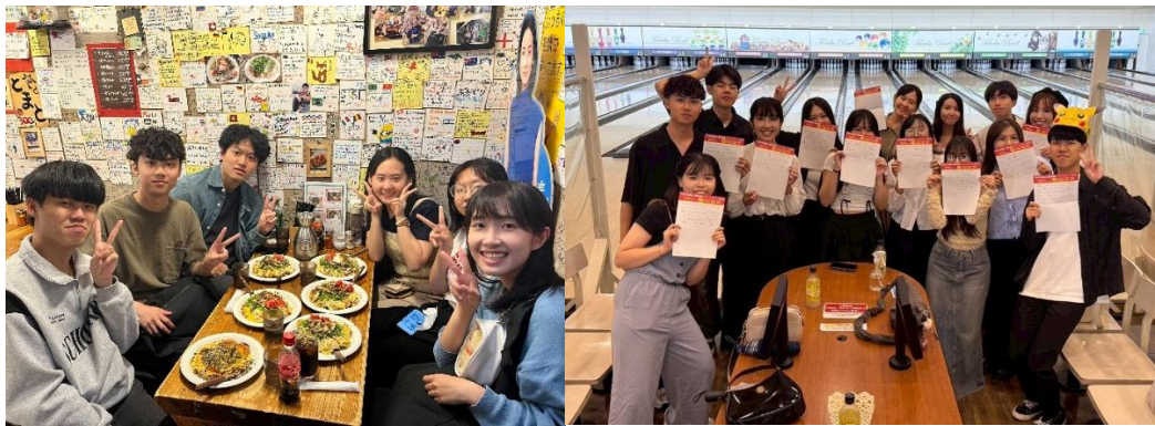
跟台灣留學生的廣島旅行