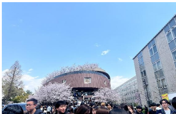
四月開學，凜風館的櫻花