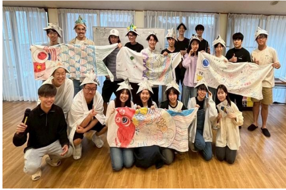
宿舍製作錦鯉旗幟活動