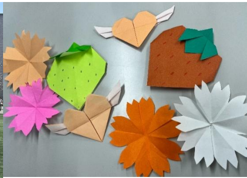
志工社團跟小朋友摺紙