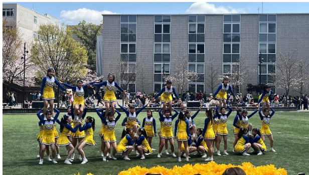
社團博覽會的表演