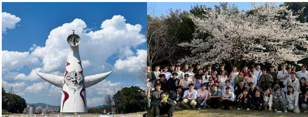
跟宿舍大家一起在舊萬博公園野餐+賞櫻