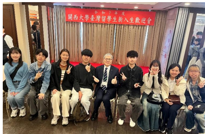
強大的關大台灣留學生會，有 2-3 次的餐會