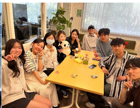
mi room 交流活動