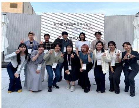
以台灣留學生身份在萬博發表