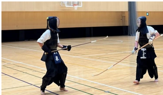
Naginata 老師跟助教展示正式比賽裝備