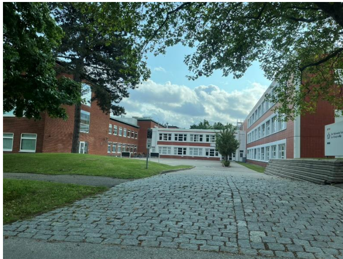
圖 2 機構之整體照片

身為國際職業安全與健康領域之重要研究機構，NFA 致力於推動前沿研究，同時也強調研究成果要能真正落實在實務中，帶來改善工作環境的實質影響，進而提升整體職場的健康與安全。