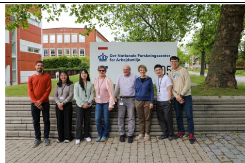
學生與各自指導師長合影留念