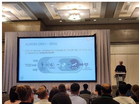
圖二、參與塑膠微粒研究主題論壇