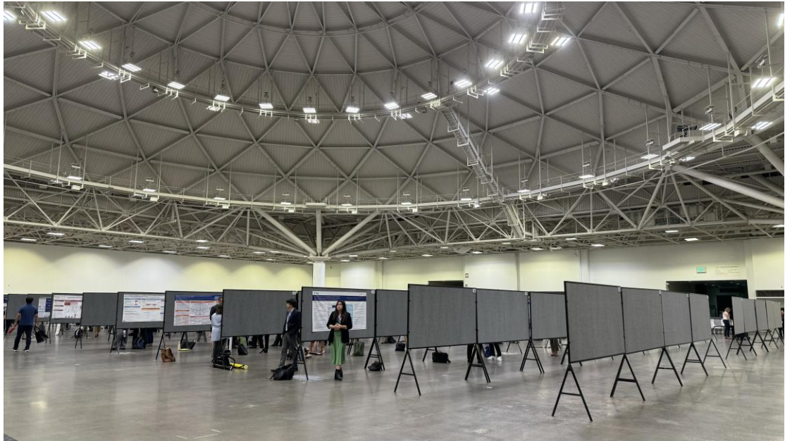
圖二、Poster Session (Exhibit Hall B, Minneapolis Convention Center)