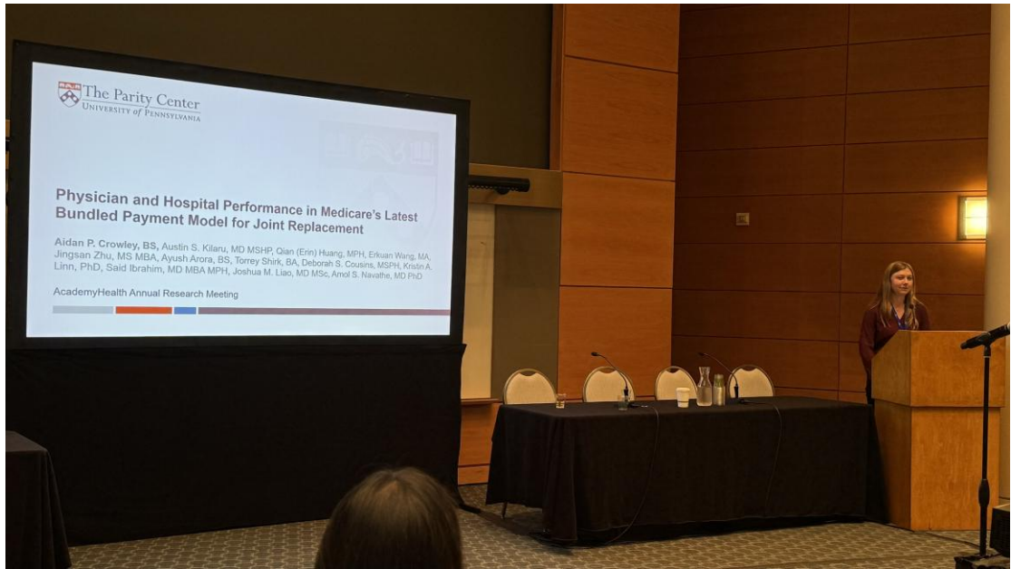
圖四、Alternative Payment Models, Quality, and Spending (Auditorium Room 3)