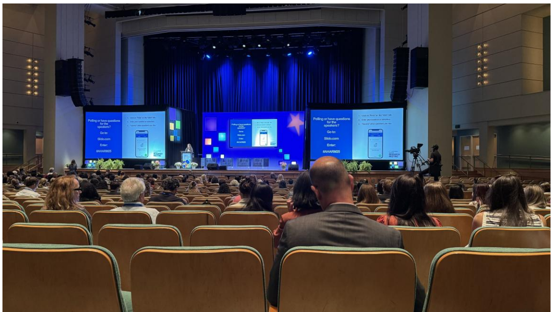
圖三、Opening Plenary (Level 1, MINCC)