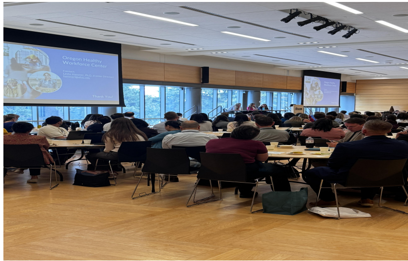
開幕式暨全體會議