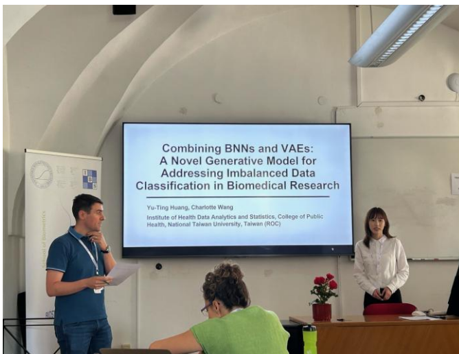
圖一：本研究於國際會議中之