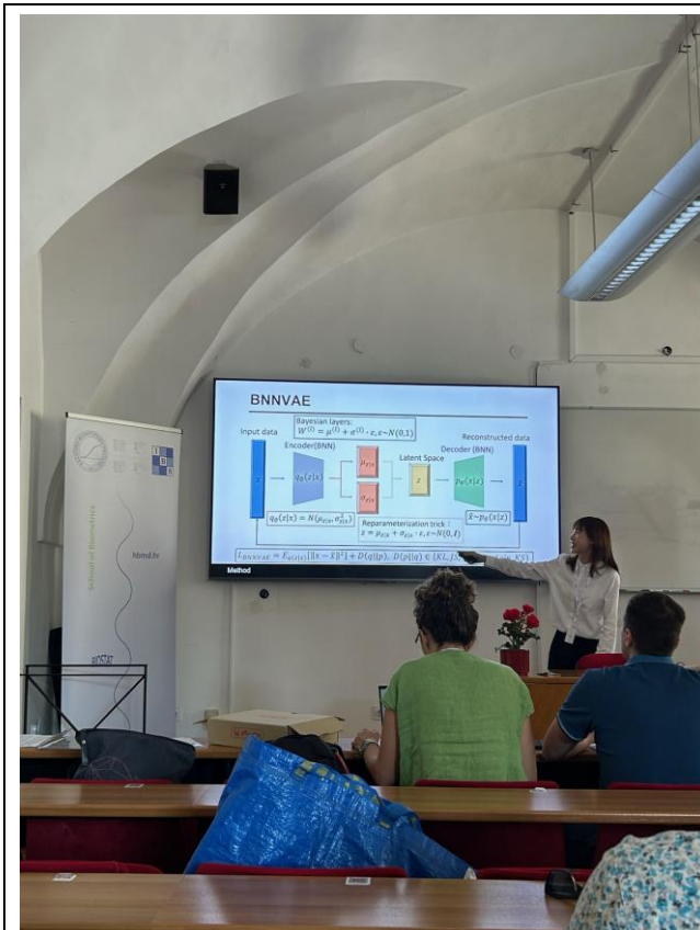
圖二：本研究於國際會議中之報告情形。