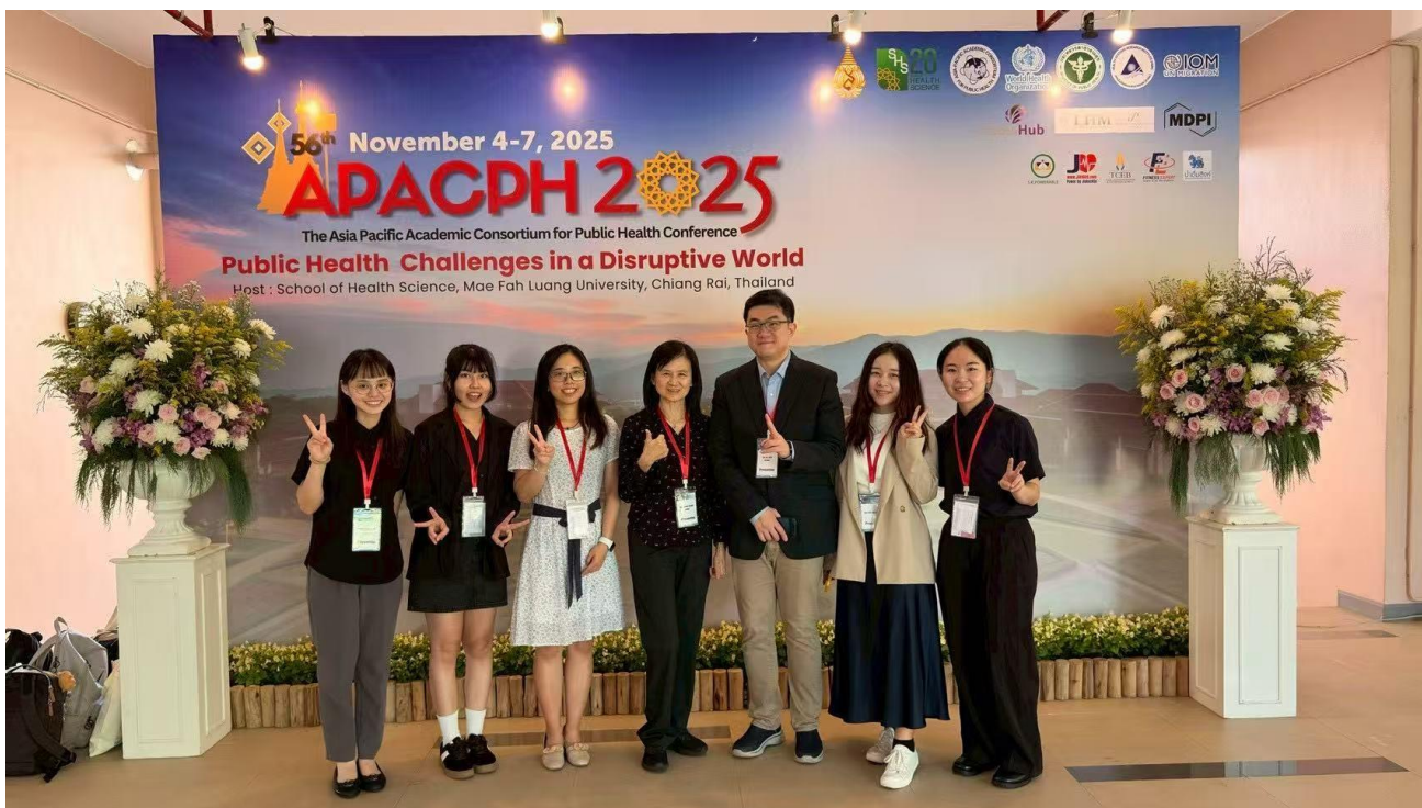
與海報、指導教授及同行老師與同學合影