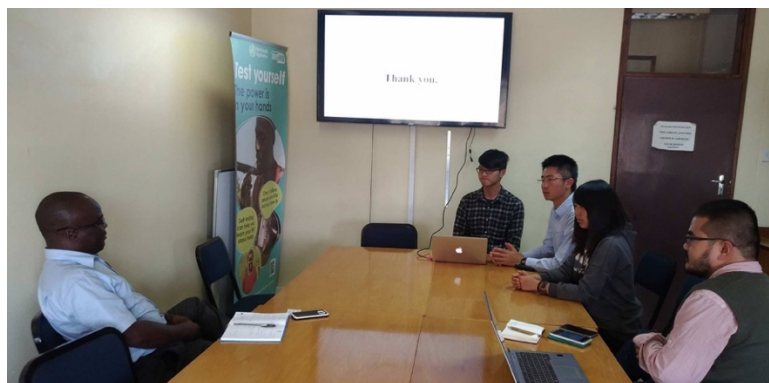
與 WHO 的官員進行會議，攝於馬拉威里朗威市

進行跨國的研究需要堅毅，像是蜘蛛補網，即使破洞很大，還是要一絲一絲將網補全，才得以完整。在馬拉威實習給了我一個機會與來自四面八方的人溝通與合作，常常會發現有資訊不對等或是資源不足之處，需要如蜘蛛般的堅毅，一點一滴把破洞補齊，這個過程磨礪了我的耐性，使我面對不同處境可以堅持到底。