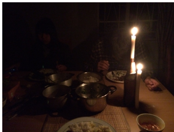
由於晚上常常沒電，我們有機會享用「燭光」晚餐

那種初來乍到的新鮮感確實在第三週後，逐漸褪去——倒也沒那麼不好，或許這意味著，我正在逐漸習慣在非洲活著。其實，不只新奇感消失，也會發現許多在民生建設不完全之處。