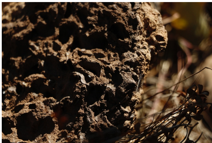
般勤的白蟻，攝於馬拉威尼卡國家公園

參與海外實習，要像螞蟻一般般勤，螞蟻把食物帶回巢穴，即使有好長一里路要走，還是得走，不走永遠不會到終點。公共衛生的研究耗費的時間很長，需要一步一腳印地向前邁進，一路上攔阻很多，但要確信終究有一個美好的目標，而般勤地走下去。