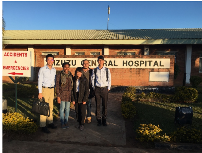
2017/7 在姆祖祖中央醫院給簡報後的合照

H 主管的分享，讓我明白：等待是有價值的，因為等待不是空等，是為了這項研究能為人群帶來長期的幫助；溝通雖然有代價，但卻不是枉然，因為溝通確保資訊的流通，也建立互信的橋樑，可以為與醫護人員合作奠基，一起為大眾的健康而努力。